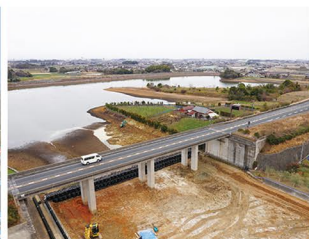
東九州自動車道 (椎田道路4車線化事業)