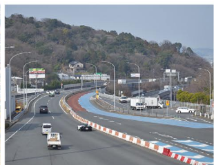
西九州自動車道 (福岡前原道路)